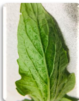
TODOS LOS COADYUVANTES SILICONADOS