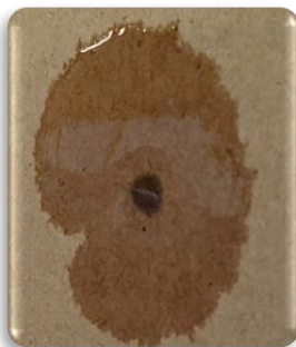
TODOS LOS COADYUVANTES SILICONADOS