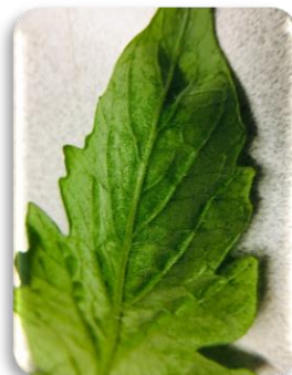
INSIDE (INCREMENTA LA PERMEABILIDAD DE LOS ACTIVOS)