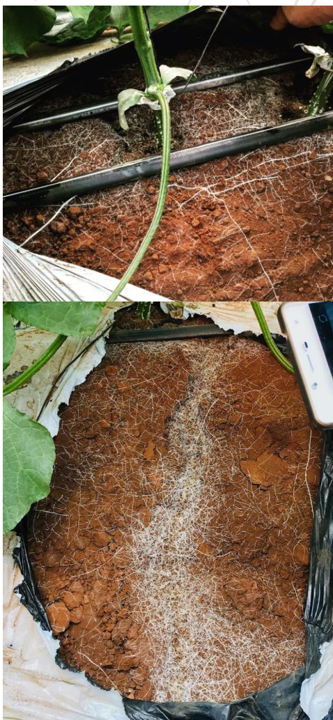
Raíz abundante, blanca, sana y recién formada.