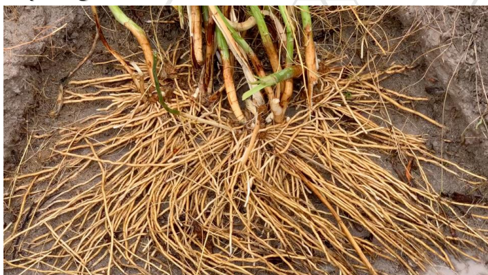
Espárrago de dos años tratado con ROOTECH.