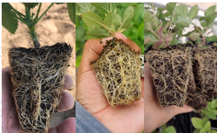
El poder de ROOTECH en plántulas.