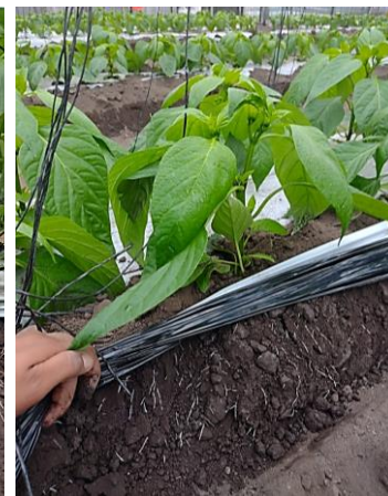
Otro promotores de crecimiento.