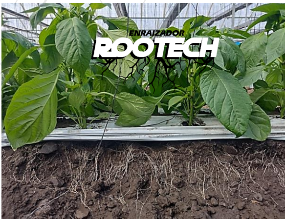
ROOTECH (3 aplicaciones, 1 L/HA)