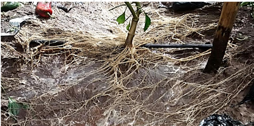
Gran capacidad de enraizamiento